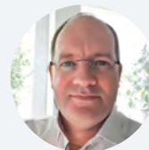
Jens Lück Bundesnetzagentur