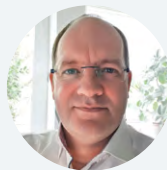
Jens Lück Bundesnetzagentur